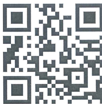
参赛项目调研问卷填报